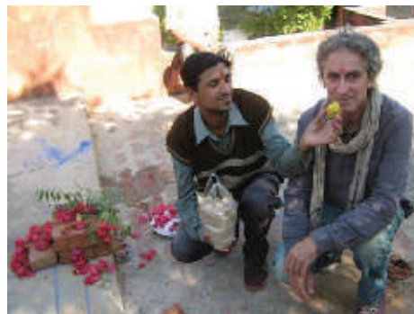
Pose de la 1 e pierre de la nouvelle GUEST HOUSE