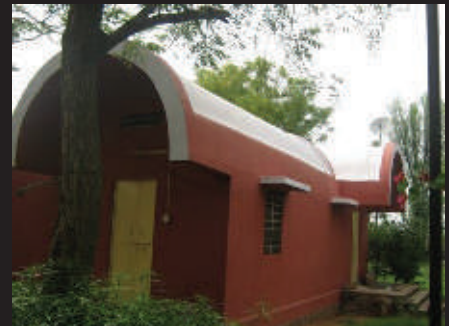
Plus de photos sur notre site...