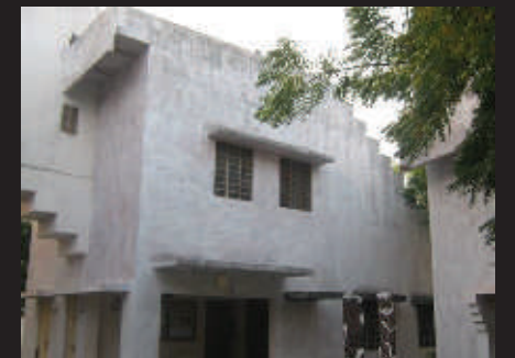
Couche primaire de la Guest house N°1 terminée