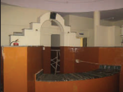
Peintures intérieures cuisines, dôme Finalisés après préparation & réparation