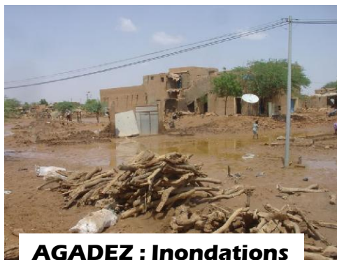
AGADEV : Inondations