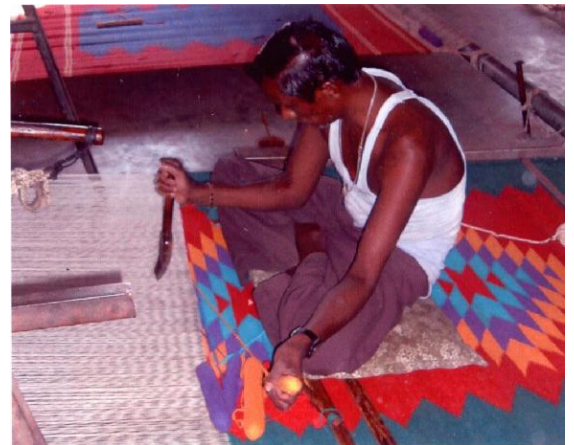
GALTA : Atelier de Tissage RAMGARH : Atelier de Couture